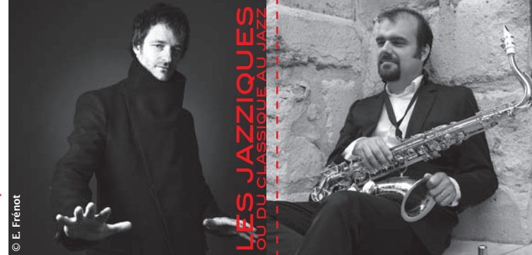
Pour la 2 e année consécutive, ce concert spécial d'avril veut montrer l'évolution et la recherche de nombreux musiciens actuels qui établissent des ponts entre des styles musicaux à priori éloignés et pourtant...