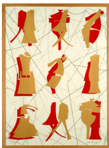
Michèle CIRÈS BRIGAND La valse des patrons , 2002