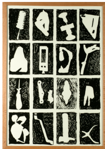
Blaise RAYMOND Outils , 2002