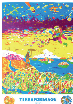
Mathilde Poncet Terraformage , 2016