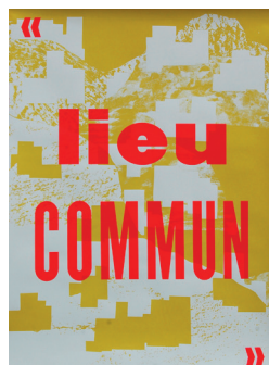
Terrains Vagues Ici Saint-Claude (série), 2017