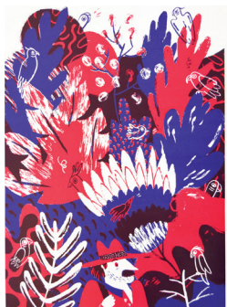
Elise Kasztelan Sans titre , 2016