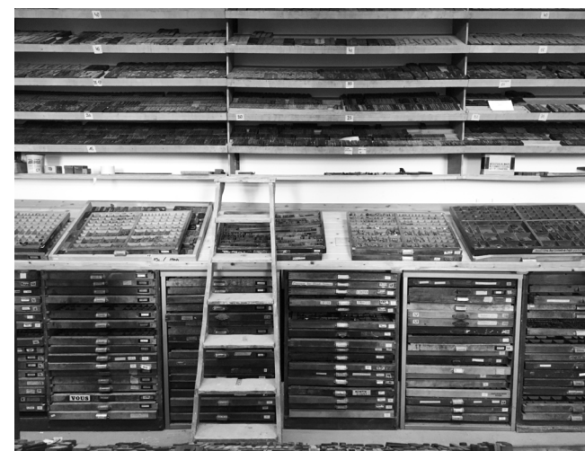
Imprimerie typographique, espace de composition